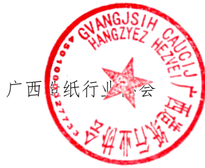
广西造纸行业协会