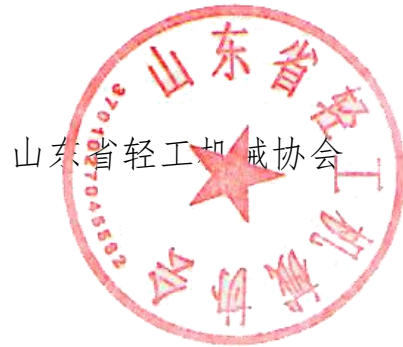
山东省轻工机械协会