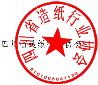
四川省造纸行业协会